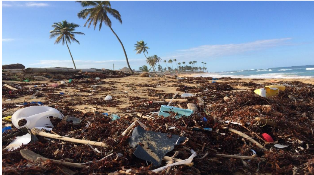
الشكل (٢) صور تأثير السياحة المفرطة علي الاستدامة بمختلف تصوراتها بالمقصد السياحي

فقدان الأصالة: مع تلبية متطلبات السياحة لجاذبية الجماهير، يمكن أن تفقد الوجهات طابعها الفريد وسحرها، وتصبح متجانسة وأقل جاذبية للسياح الباحثين عن تجارب أصيلة ( Butler, R., 2006). مخاوف تتعلق بالسلامة والأمن: يمكن أن يؤدي الاكتظاظ وضغط البنية التحتية إلى مخاوف تتعلق بالسلامة وزيادة الجريمة، مما يجعل الوجهة أقل جاذبية للسياح ( Brookings Institute, 2017).