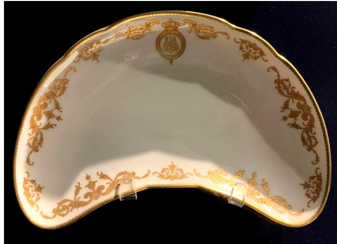
(لوحة ٨) صحن على شكل هلال للملك فاروق

الملكي المتصل به على شكل خاتم ملكي. المنطقة الداخلية من اللوحة: واضحة.