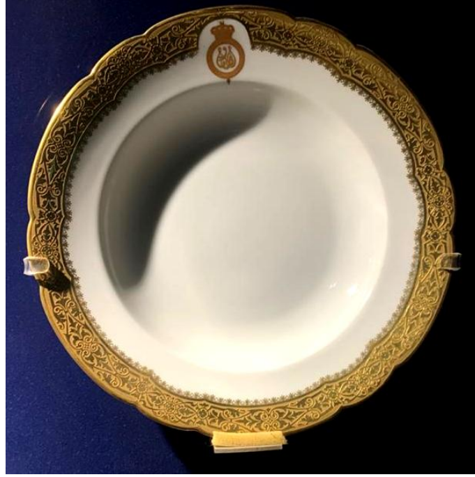
(لوحة ٦) دائرية عميقة للملك فاروق