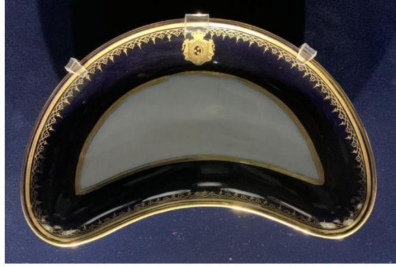
(لوحة ٤) لوحة: صحن على شكل هلال للخديوي عباس حلمي الثاني