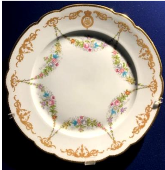
(لوحة ٩) صحن دائري مسطح بتصميم فسطون للتحلية للملك فاروق

اللون: أبيض مع إطار عريض مذهّب مزين بأزهار متعددة الألوان. الزخرفة: صحن مزين بزخارف مورقة متكررة، مصمم على طراز الباروك والروكوكو بحجمين مبطن على الإطار، حافة غير منتظمة مزينة بحزام رفيع مذهّب. وتتصل الزخارف الأصغر حجماً بأطراف نجمة سداسية الشكل مزينة بأزهار متعددة الألوان لتزين وسط الصحن. ترتبط نقاط النجمة بخطوط منحنية إلى الداخل من الزهور تشبه الأكاليل التي تحتضن مساحة بسيطة في المنتصف. ويوجد في أعلى الصحن حرف ذهبي للاسم العربي للملك فاروق (فاروق) صاحب القطعة، بالخط الديواني، داخل شكل دائري يعلوه تاج ملكي متصل به على شكل خاتم ملكي (لوحة ٩).