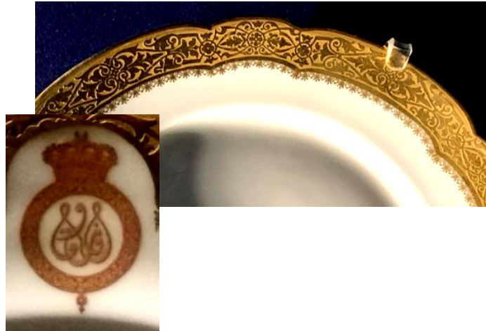
(لوحة: ١٦) المونوغرام الملكي للملك فاروق