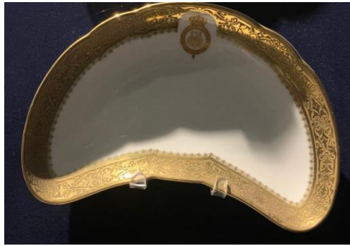
(لوحة ٧) لوحة: صحن على شكل هلال للملك فاروق