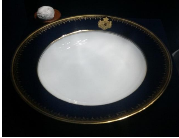
(لوحة٥) صحن دائري عميق للخديوي عباس حلمي الثاني