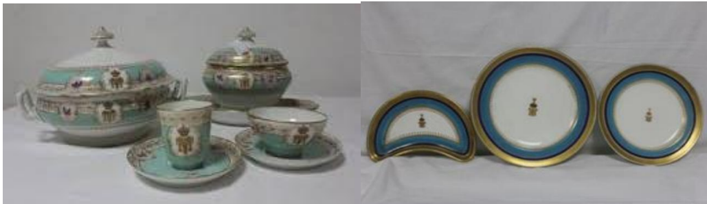
(لوحة ٢) أطقم أواني الخزف للخديوي محمد توفيق بمتحف قصر المنيل