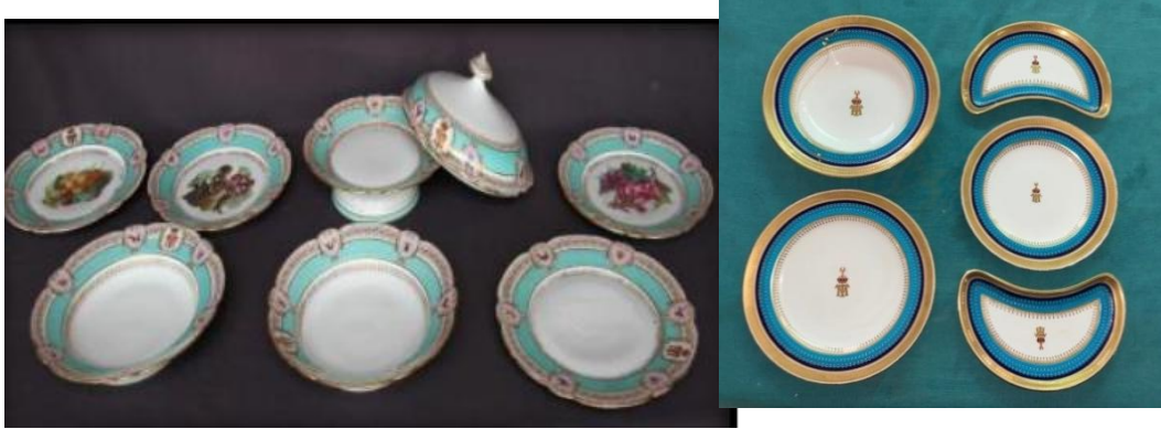
(لوحة ١) أطقم أواني الخزف للخديوي محمد توفيق بمتحف الوادي الجديد

مدورة مذهبة تشبه المسبحة أو القلائد الدائرية، وشريط أزرق رفيع محدد بزخارف مذهبة دقيقة، يليه حافة واسعة مذهبة، بعض القطع دائرية والبعض الآخر نصف دائرية على شكل هلال منحنى قليلاً، وفي المنتصف الحروف الشخصية للخديوي. المجموعة الثانية مزينة بشريط عريض من اللون الفيروزي الفاتح تحدده زخارف مذهبة دقيقة ومعرزة بسبع رصائع جميلة ذات زخارف مختلفة؛ إحداها تحمل الحروف الشخصية للخديوي محمد توفيق وبعض القطع مزخرفة في المنتصف بزخارف فواكه مختلفة وأخرى بيضاء فارغة، وللوعاء قاعدة مرتفعة قليلاً وغطاء على شكل بصيلة ينتهي بمقبض متكتل (لوحة ١). بعض قطع هذه المجموعات معروضة في متحف قصر المنيل (لوحة ٢). وتحمل جميع قطع الخديوي محمد توفيق بعض العلامات الملكية مثل التاج الملكي والأحرف الأولى باللغة الإنجليزية.